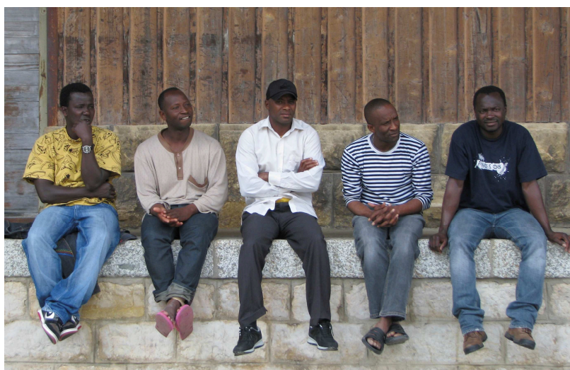
Discussion entre hommes...