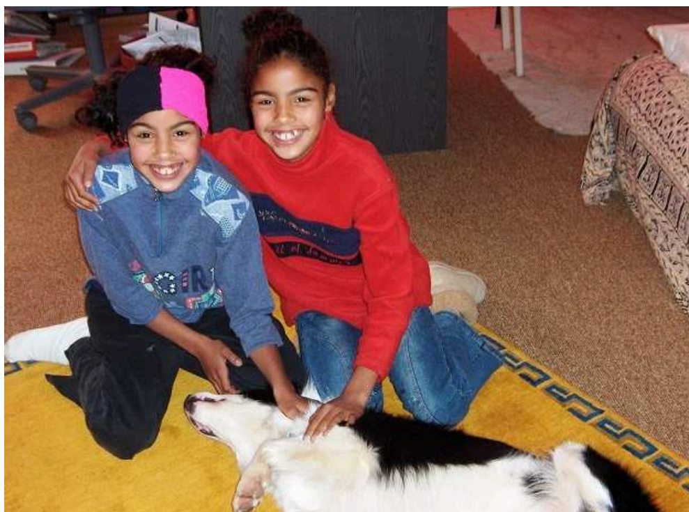
Une amitié en devenir