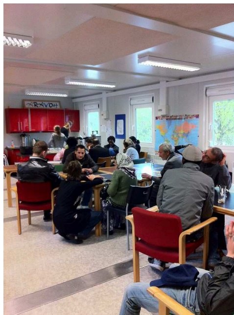
Salle comble chez « Mama Africa »

D'autre part, comment quantifier le temps passé à jouer avec les requérants et à gérer l'armoire des jeux; le temps passé à écouter tant de terribles périples pour arriver dans la « terre promise »...; le temps passé à ramasser les débris autour des modules d'accueil avec quelques requérants prêts à nous rendre service; le temps passé à chercher dans son entourage la paire de chaussures qui remplacerait les « tongs » ou la veste un peu plus chaude qu'un « Kway » pour affronter la rigueur de nos hivers?