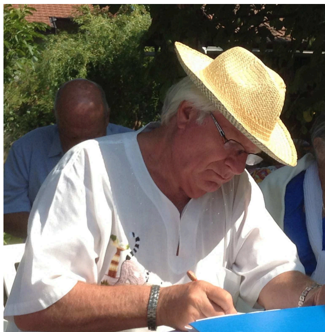
Notre secrétaire au travail, lors de la Journée extra-muros...