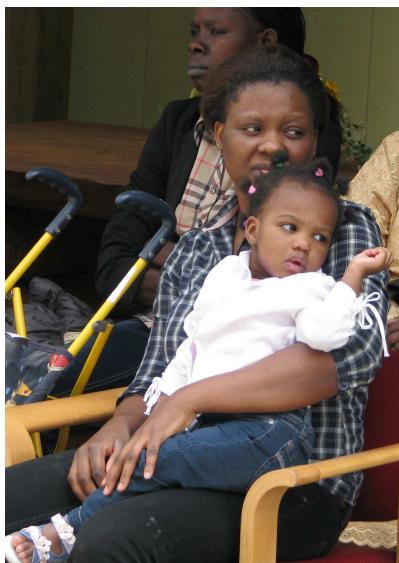
Trois spectatrices à la Journée des réfugiés