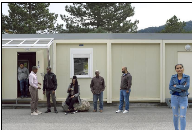
Notre local d'accueil