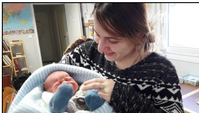
Une maman et son nouveau né

Bénévoles de l'accueil et d'Internet Corner ainsi que les jeunes du GADeM, nous avons tous ensemble maintenu nos locaux ouverts cinq jours sur sept, avec toujours la possibilité pour les requérants, peu importe leur nombre, d'accéder à un ordinateur à l'Internet Corner, de consulter l'aide juridique du SAJE, de bénéficier de l'assistance de nos stagiaires ou alors tout simplement de boire un café, faire un puzzle, un jeu, parler ou juste écouter.