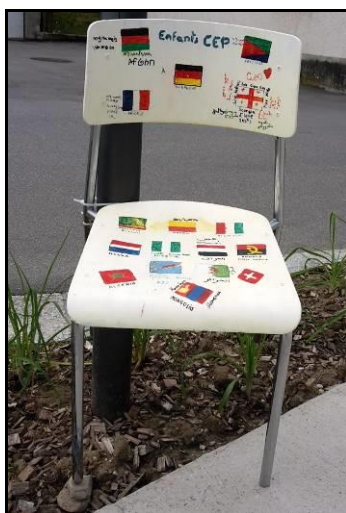
Chaise décorée à l'atelier