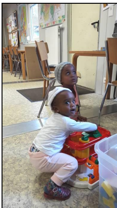
Surpris en plein jeu !

Une année avec beaucoup de questions quant à l'avenir du Centre et à la fréquentation de nos locaux par un nombre beaucoup moins élevé de requérants. Où allons-nous et comment bien faire ? Ce qui nous a amené à quelques réflexions sur notre rôle mais jamais n'a entamé notre désir d'offrir cet accueil si précieux à tous celles et ceux qui désiraient venir passer du temps chez nous.