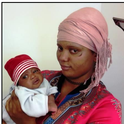
Jeune maman nigériane

Prenons le cas d'une jeune maman nigériane qui devait porter sa fille âgée de quelques semaines, ne possédait rien d'autre que sa robe "boubou" mais qui, heureusement, parlait un peu d'anglais. Il est difficile d'imaginer comment elle aurait, avec son bébé, pu prendre train, bus et métro pour se rendre du CEP de Vallorbe au centre EVAM à Lausanne. Qu'ensuite, elle ait sur place pu procéder à toutes les formalités administratives, pour enfin trouver son chemin jusqu'aux locaux de l'EVAM à Crissier où elle a été attribuée.