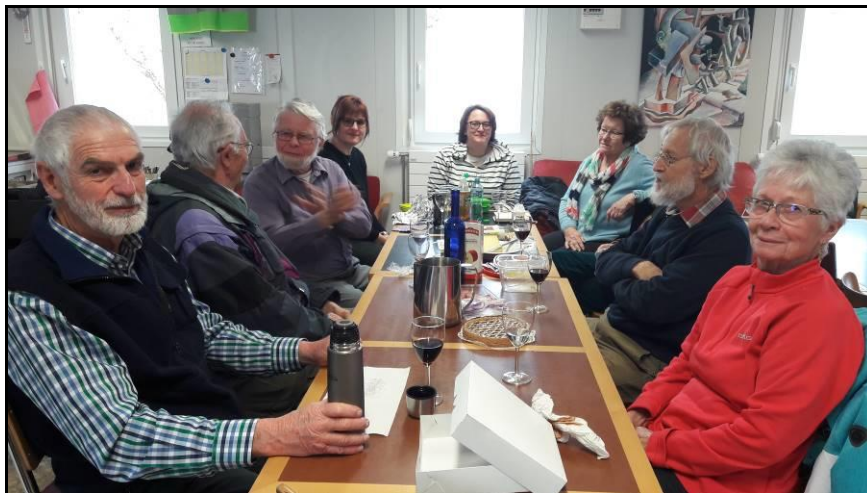
Réunion du groupe "Visites culturelles"