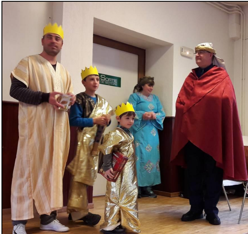
Fête de Noël