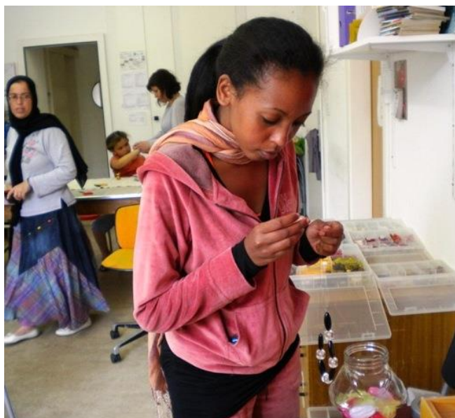
Il s'agit de bien choisir les perles ...