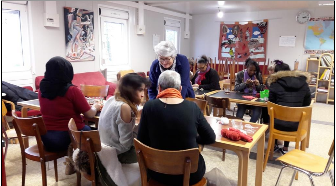
Divers tricots et travaux au crochet