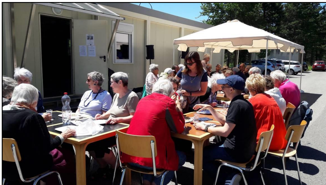
Repas canadien devant nos locaux