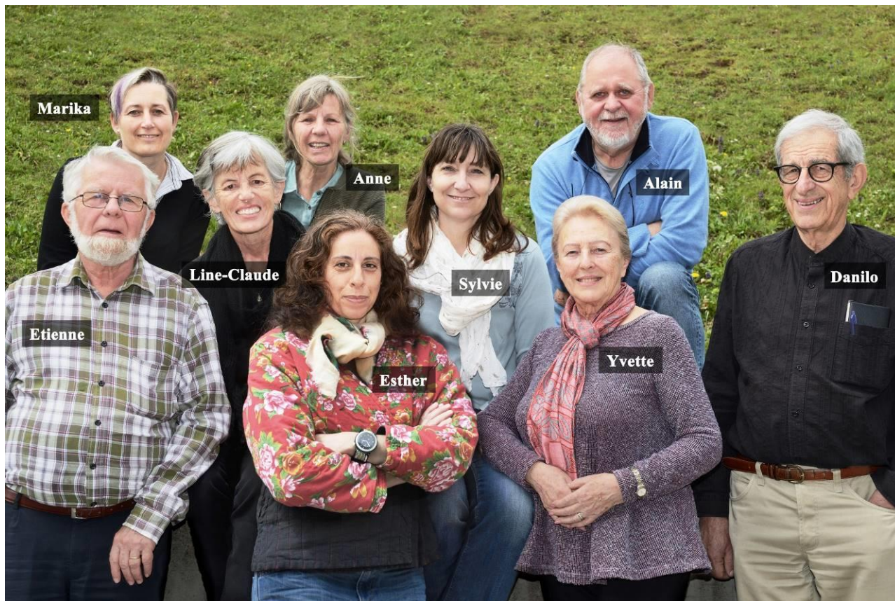
Equipe du comité