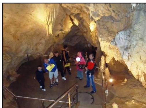
Visite des Grottes de Vallorbe