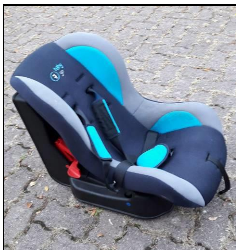
Siège bébé mis à disposition pour "Taxi" bénévole