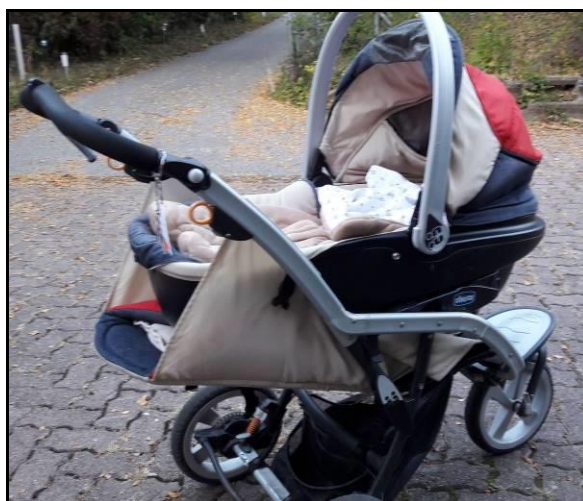
Poussette garnie demandée et offerte à une jeune maman